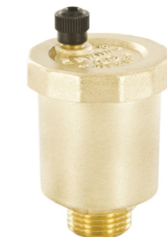
Art. 502 (odpowietznik automatyczny)