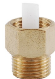
Art. 539 (zawór stopowy)